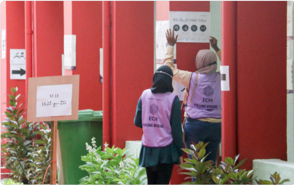
◀ ڳڻپ ڪندڙن جي ڪارروائي ۽ ڳڻپ ڪندڙن جي ڪارروائي