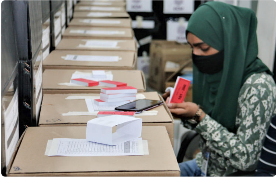
◀ اړیکو، ځانګړتیاوو او ځانګړتیاوو په څرګندولو کې د ځانګړتیاوو د څارنې په لړ کې ونډه اخلی.