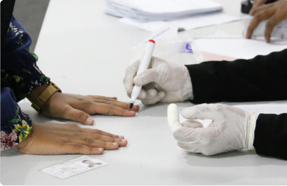
◀ وڃڻ وٽ ڊاڪٽرن ۽ نرسن جا ٽيم جوڙڻ ۽ ڪم ڪرڻ جي ڪارڊ ڏيکارڻ