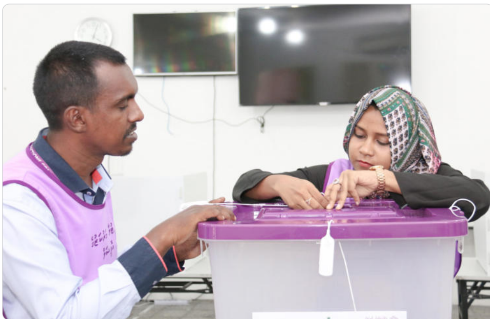
◀ قوچۇرلارنىڭ سېزىمچىلىقىنى ئۆزگەرتىش ۋە تەكشۈرۈش ۋەزىپىسىنى ئادا قىلىش ئۈچۈن