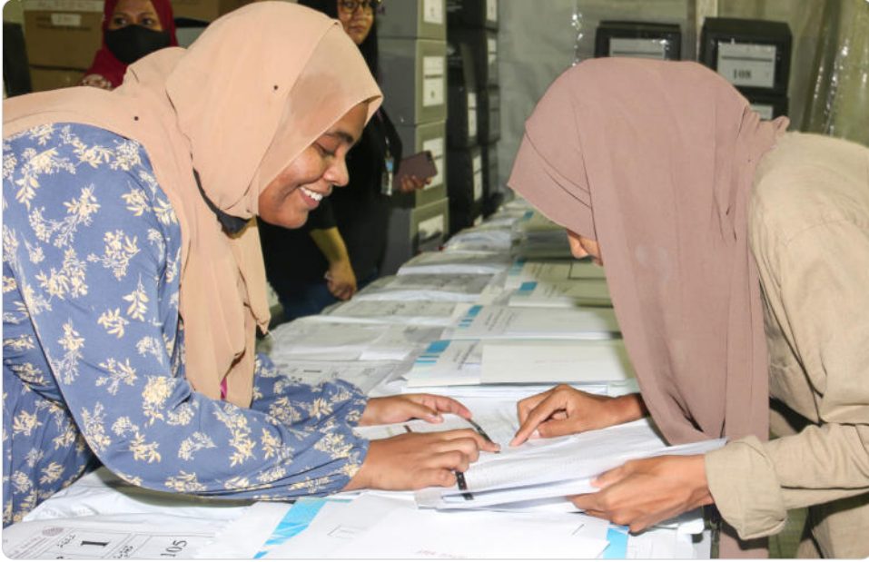
◀ ڳڻپ ۾ ڪم ڪندڙن جي ڪارروائي ۽ ڳڻپ ڪندڙن جي ڪارروائي