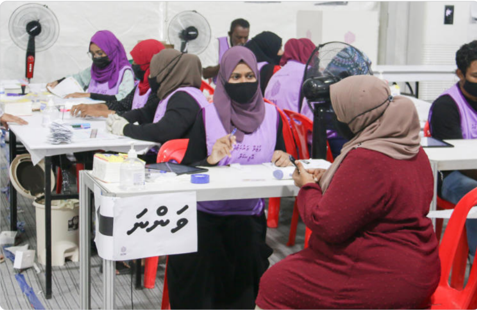
◀ 2021 وٽ ڊاڪٽرن ۽ نرسن جا ٽيم جوڙڻ ۽ ڪم ڪرڻ جي ڪارڊ ڏيکارڻ